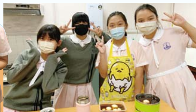
美食 fun 享