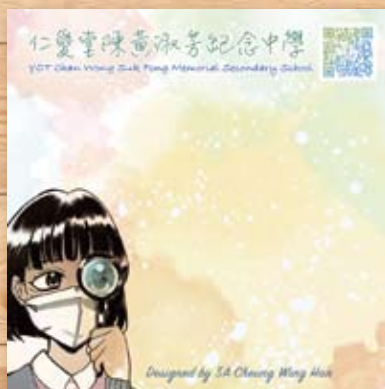
Memo紙： 5A 張詠嫻 4C 楊佩雯