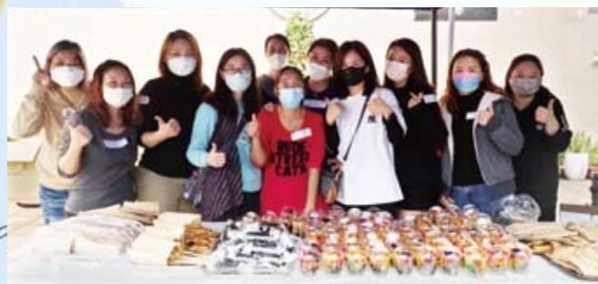
美食當前，一眾師生踴躍捐款，大快朵頤。