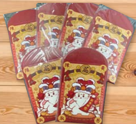
利是封：4A 羅詠欣 4A 曾琳