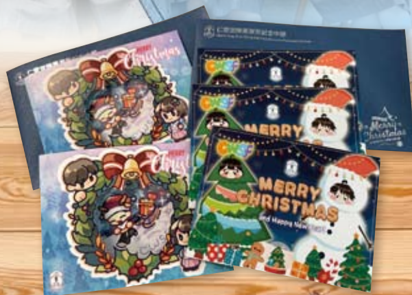
聖誕卡：4C 楊佩雯 2A 陳美廷