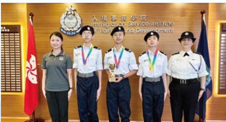
入境事務處青年領袖團聯校升旗手大賽