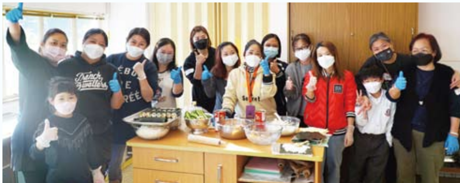
家教會委員及家長義工一起預備籌款日小食。