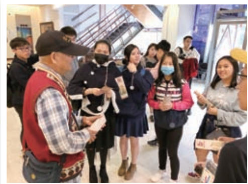
原住民義工爺爺為同學講解台灣民族的歷史