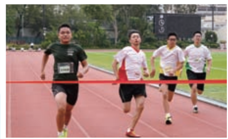
陸運會2 - 只差一步