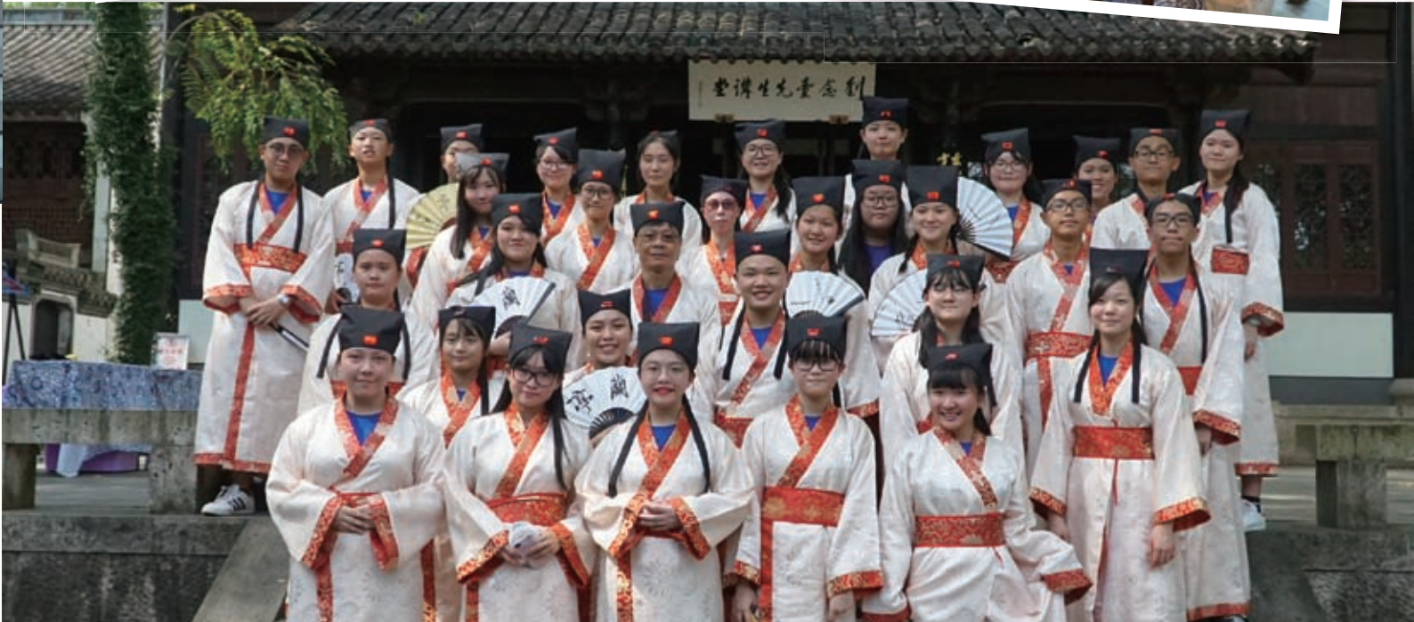
到訪書聖故里感受古時的讀書氣氛

我很高興可以參加這次浙江交流團。在這六日五夜的行程中，無論交流、參觀或探訪都令我獲益良多。我們分組深入杭州、寧波、溫州、湖州、嘉興、紹興、金華、衢州、舟山、台州、麗水11個城市，感受浙江省不同地區的文化和發展。參與是次交流團的我認識到當地歷史文化和發展狀況，而每一天的行程都很充實。