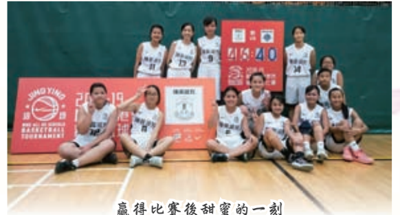
贏得比賽後甜蜜的一刻