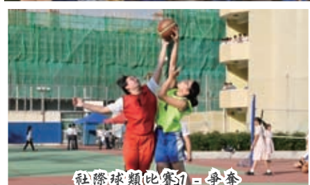
社際球類比賽1 - 爭奪