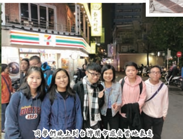
同學們晚上到台灣鬧市感受當地氣息