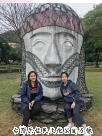
台灣原住民族文化公園石像