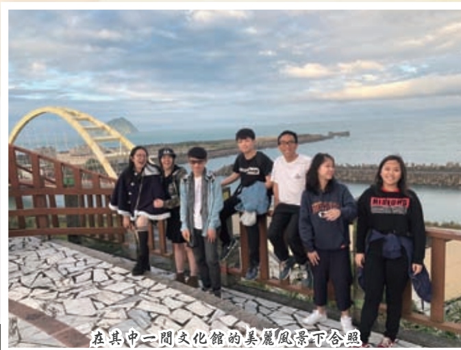
在其中一間文化館的美麗風景下合照