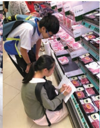
格價專家-同學在超市作價格比較