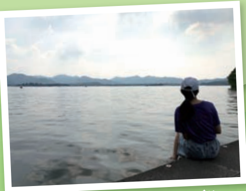
眼前的是西湖的美景，令人心曠神怡。