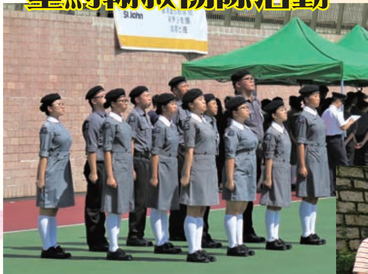
參與少青團隊際比賽