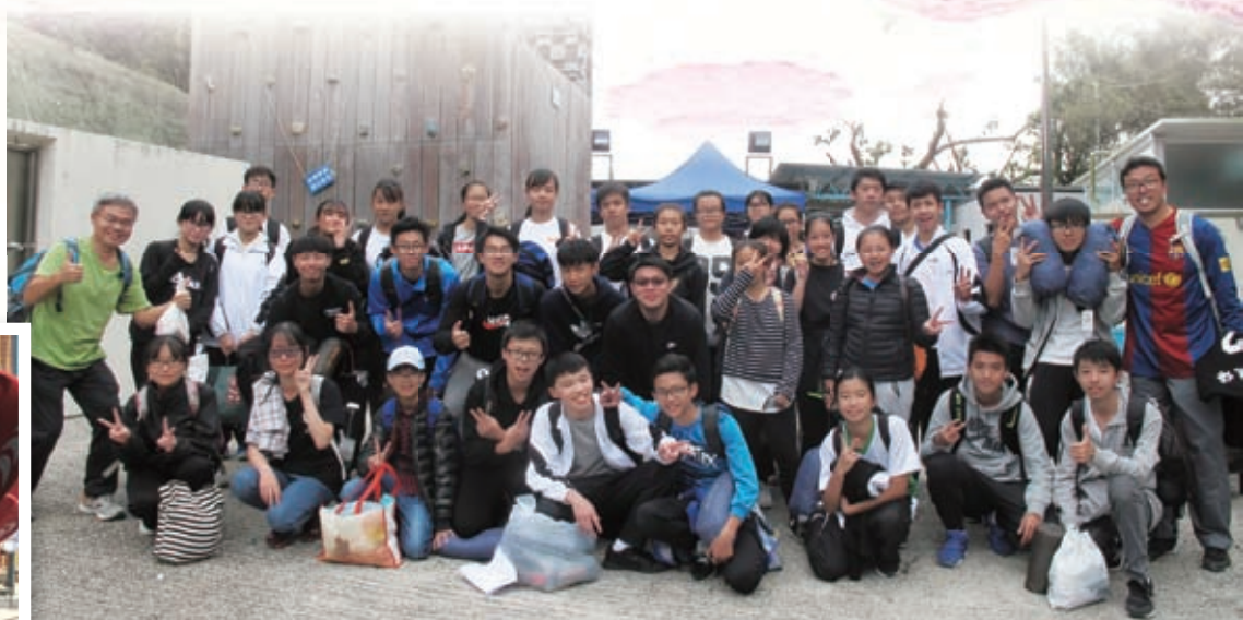
全體參加同學大合照