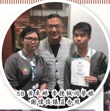
5B 黃卓琳 李德誠同學跟謝偉俊議員合照