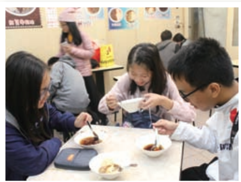
感受台灣的飲食文化