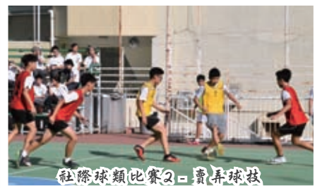
社際球類比賽2 - 賣弄球技