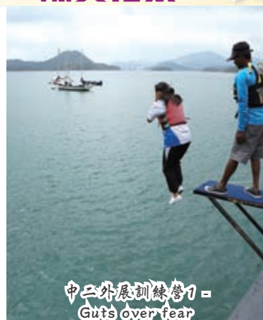
中二外展訓練營1 - Guts over fear