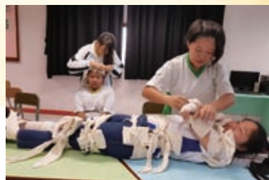
聖約翰救傷隊急救班訓練