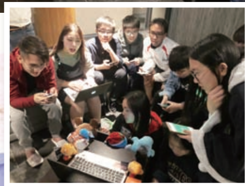
同學們晚間在酒店時仍不忘學習