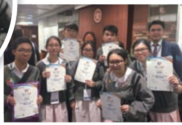
模擬立法會： 5B 學生跟律師合照