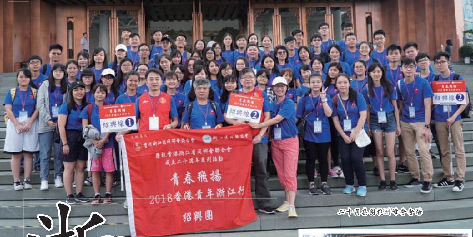
二十國集團杭州峰會會場