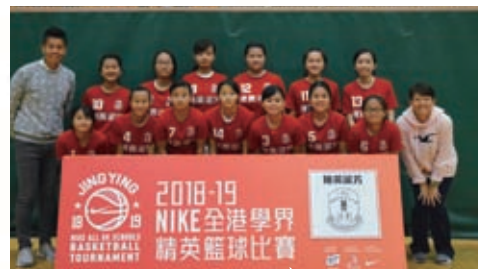
女子籃球隊代表屯門參加學界精英籃球比賽