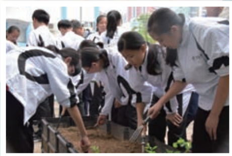
種植活動展現同學照顧的愛心