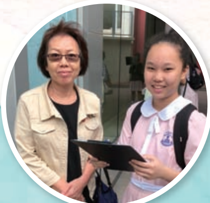
同學邀請街坊作訪問