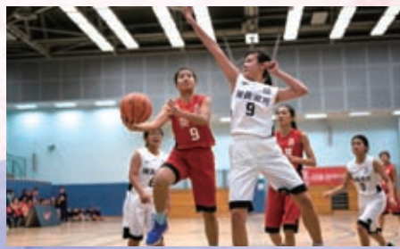
學界精英1 - Not on my watch!