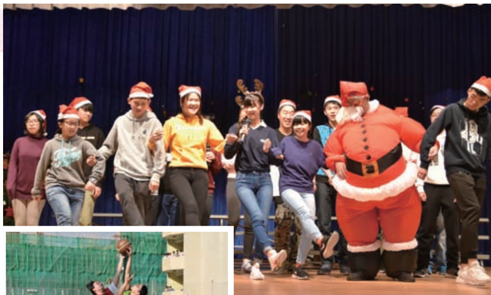
天才表演2 - 吃胖了的聖誕老人與漂亮的馴鹿