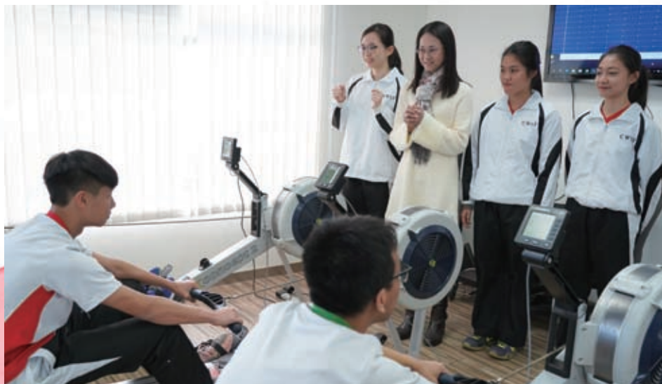
鼓勵學生力爭表現