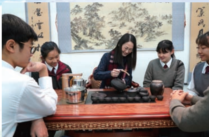
與學生茶室品茗，親切交流