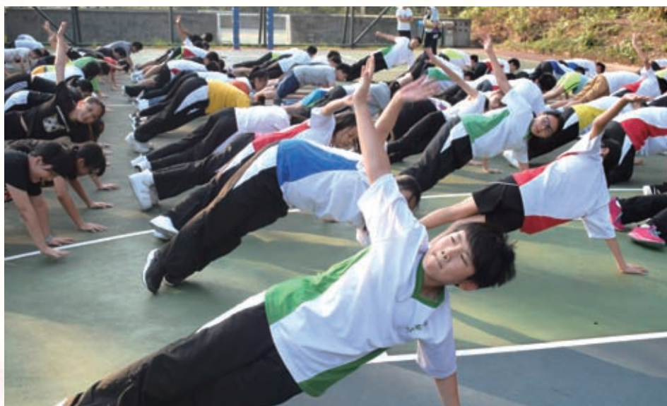
中一教育營1 - 強化核心