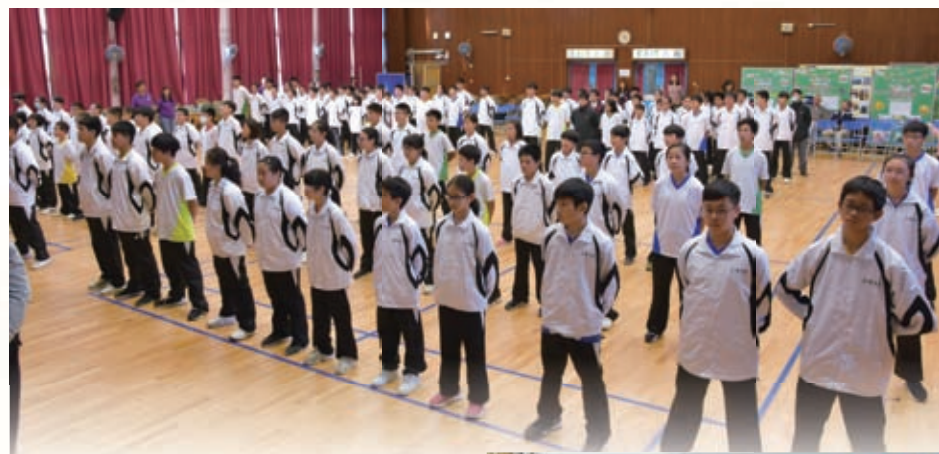
步操能訓練同學專注認真