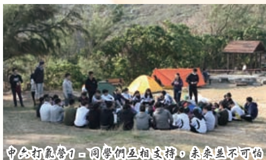
中六打氣營1 - 同學們互相支持，未來並不可怕