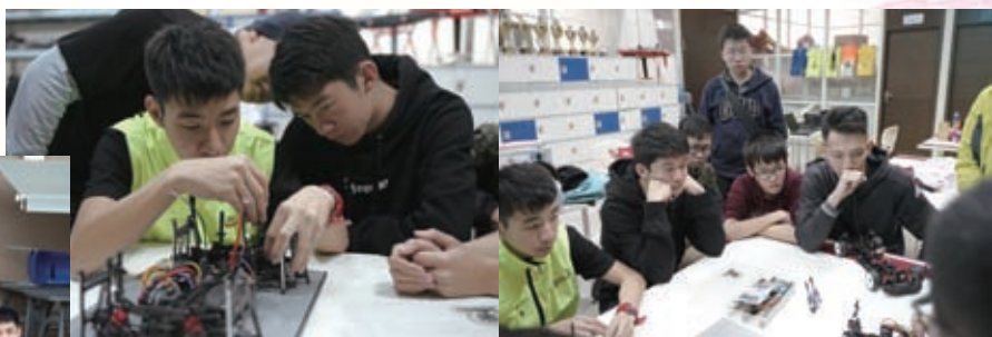
隊員一起鑽研改裝比賽車輛