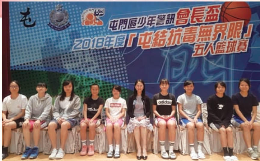
屯門區少年警訊會長盃亞軍隊員與校長合照