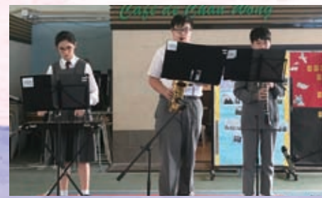
管樂團1 - 希望同學們能在美妙的旋律中享用午膳