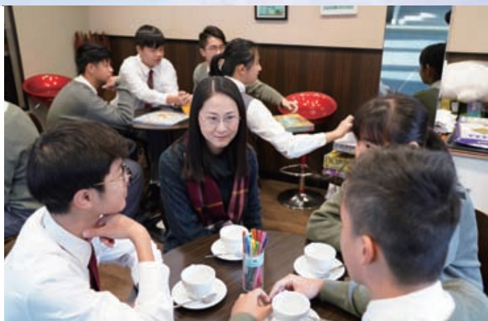
在陳黃Café中輕談淺說