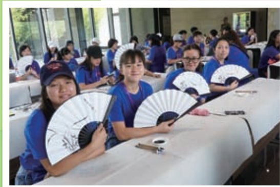
書法博物館繪畫紙扇