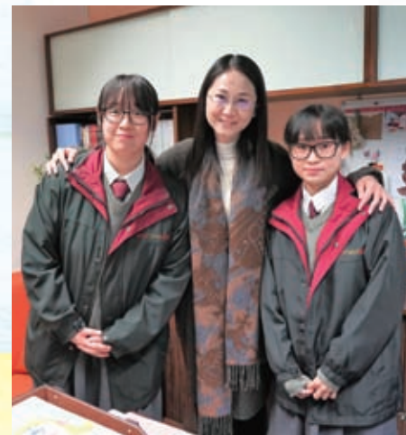
與傳真小記者合照