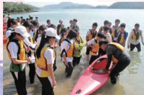
歷奇訓練能啟發同學接受挑戰的極限