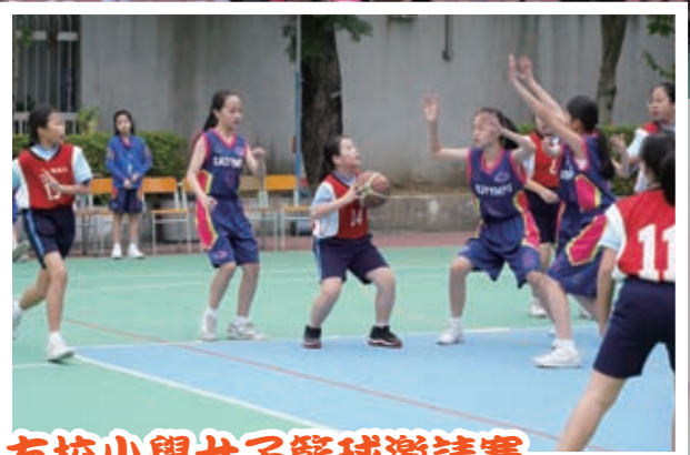
友校小學女子籃球邀請賽