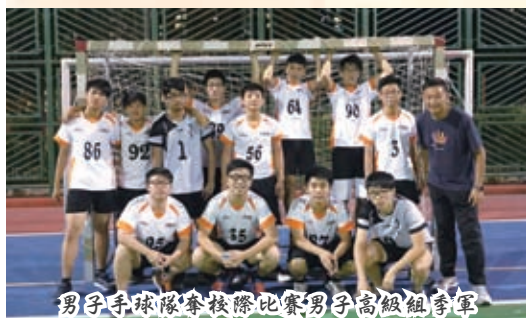
男子手球隊奪校際比賽男子高級組季軍