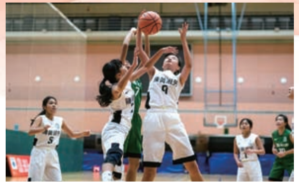
陳黃隊員力拒來犯