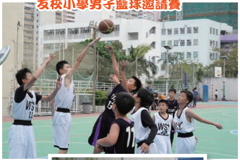
友校小學男子籃球邀請賽