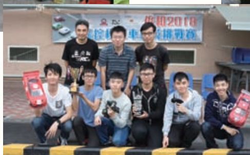
俊和2018遙控模型車精英挑戰賽 我校同學奪獎