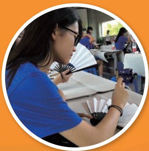
在蘭亭中寫書法，感受其文化氣息。

雖然只有短短六天，但令我得著很多，即使未能深入瞭解整個浙江，但也能親身體會浙江的生活，加深我對當地文化的認識，加強我對中國人這個身份的認同和歸屬感。而且和當地人進行交流，令我的國語能力大大加強。和其他團友相處，亦增強了我的溝通能力。我很榮幸可以在杭州留下我的足印！