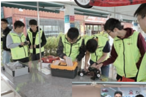
比賽前檢查 車輛裝置