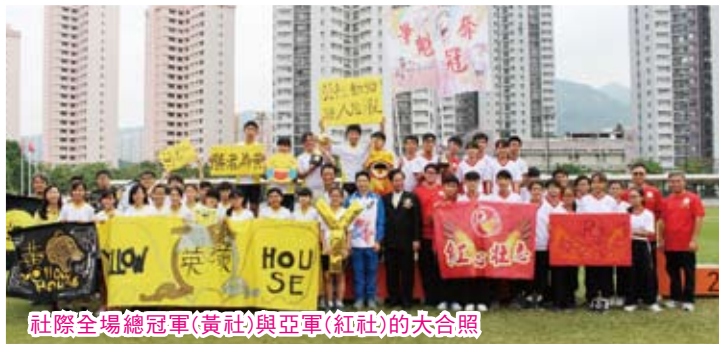
社際全場總冠軍(黃社)與亞軍(紅社)的大合照