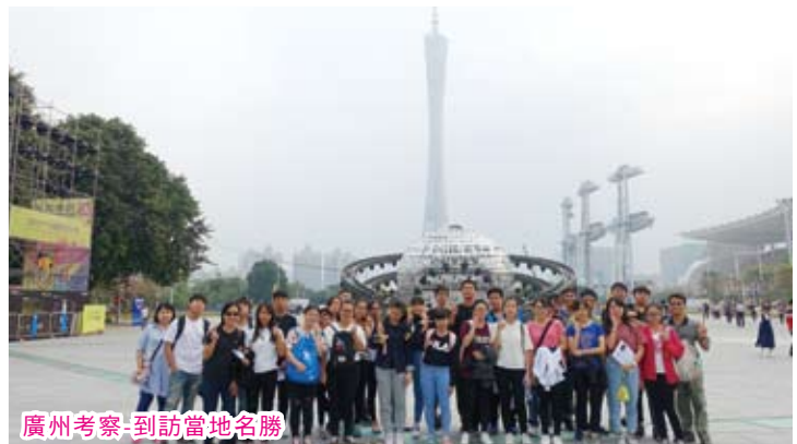
廣州考察-到訪當地名勝