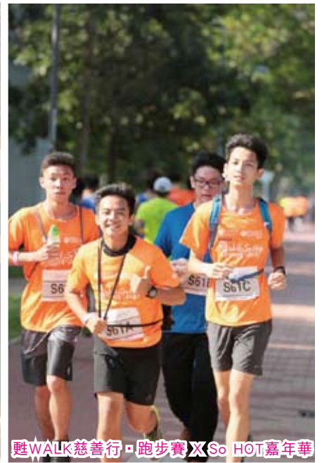
甦WALK慈善行·跑步賽 X So HOT嘉年華