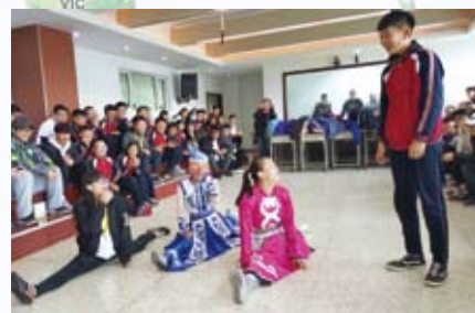
「民族融合之旅·內蒙」考察學習團2018