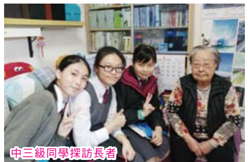
中三級同學探訪長者