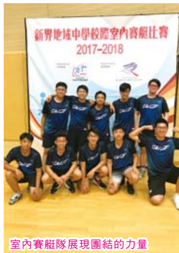
室內賽艇隊展現團結的力量