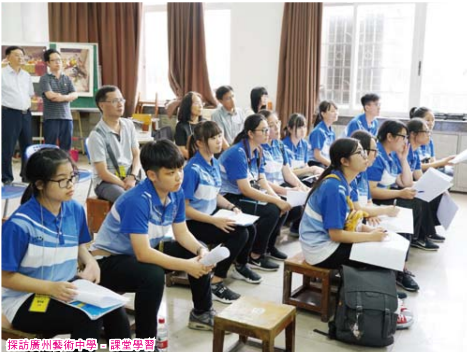
探訪廣州藝術中學 - 課堂學習