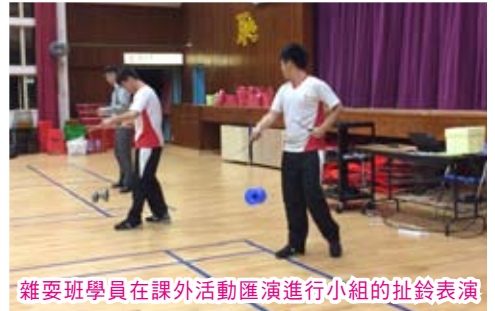
雜耍班學員在課外活動匯演進行小組的扯鈴表演