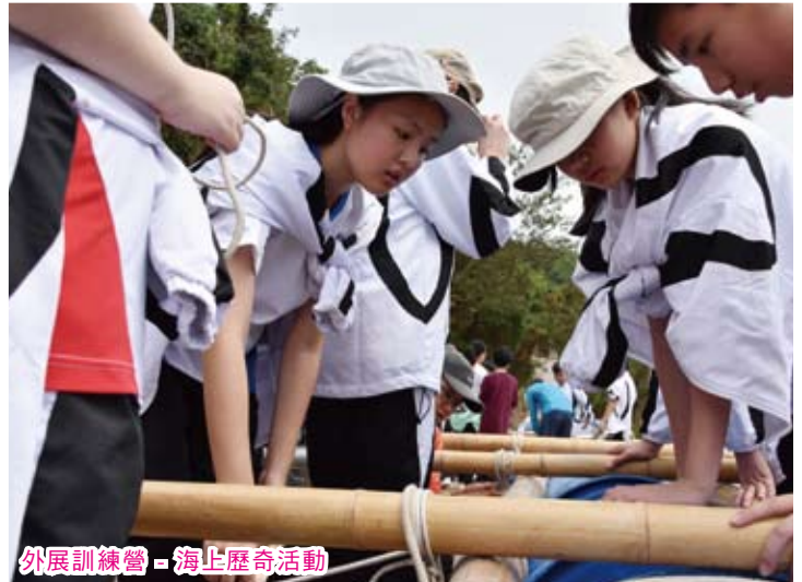
外展訓練營 - 海上歷奇活動