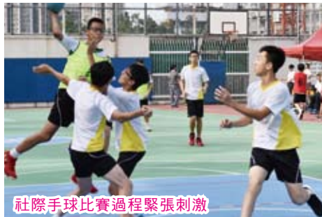
社際手球比賽過程緊張刺激