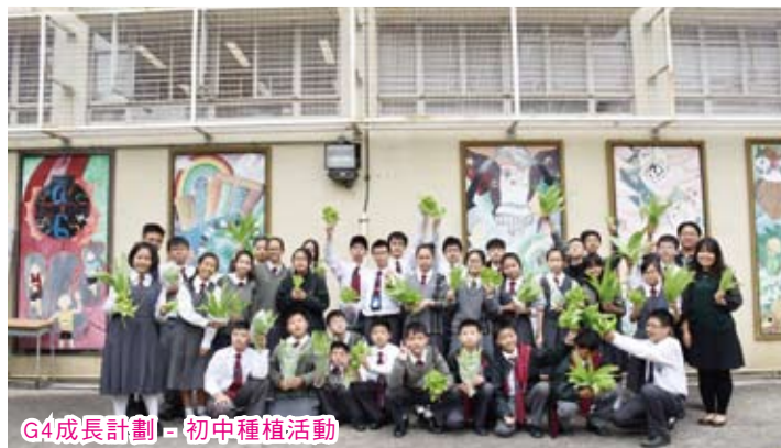
G4成長計劃 - 初中種植活動