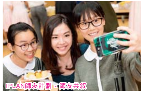
IPLAN師友計劃 - 師友共叙