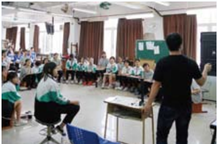
廣州市美術中學交流團2018