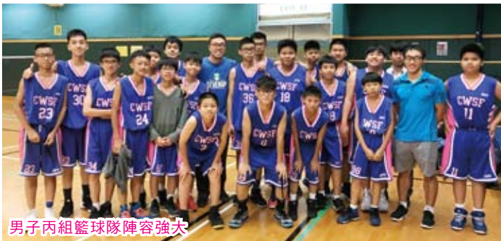
男子丙組籃球隊陣容強大