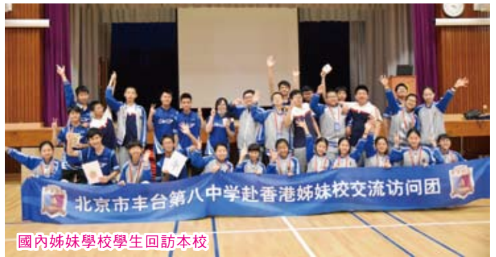
國內姊妹學校學生回訪本校

為支援學生在成長中遇到的問題，培養學生的正面價值觀，本校會為各級學生籌辦不同的全級性成長活動，讓學生在同心協力、共同進退的情況下，一同學習、一同面對，增強學生的友誼、自信及協作。亦會透過不同的社區服務活動及國內、外考察活動，讓學生了解社區、認識各國情況。在各級亦設生涯規劃課程，以班主任節及周會，促進學生了解自己，思考未來發展。種種的成長支援項目，目的在培育我們的學生全面發展，仁德兼備。