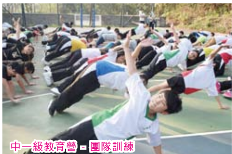
中一級教育營 - 團隊訓練