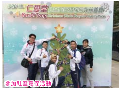
參加社區環保活動