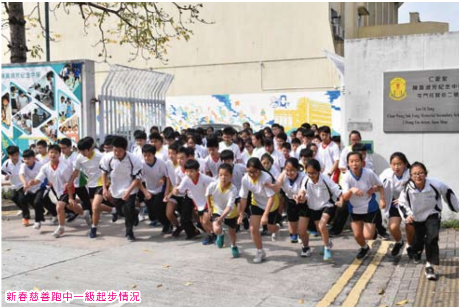
新春慈善跑中一級起步情況