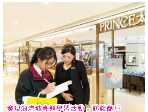
發現海港城專題學習活動 - 訪談商戶