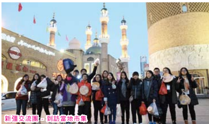
新疆交流團 - 到訪當地市集