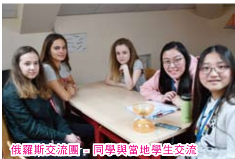
俄羅斯交流團 - 同學與當地學生交流