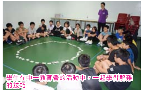
學生在中一教育營的活動中，一起學習解難的技巧