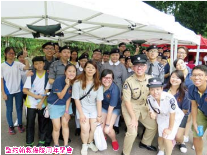
聖約翰救傷隊周年聚會