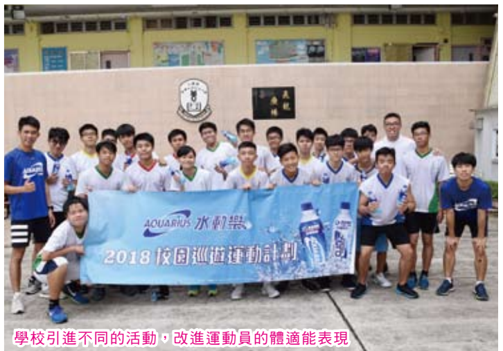
學校引進不同的活動，改進運動員的體適能表現