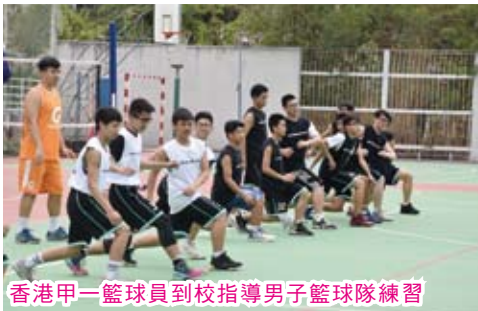
香港甲一籃球員到校指導男子籃球隊練習