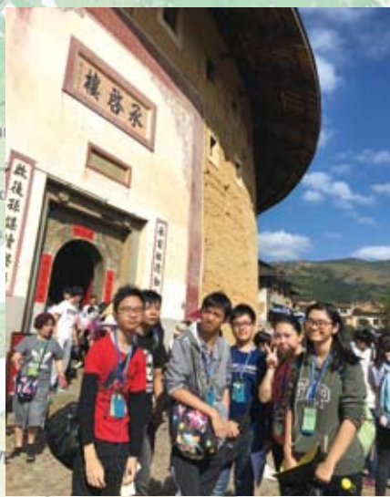
廈門咪咕動漫體驗團2018