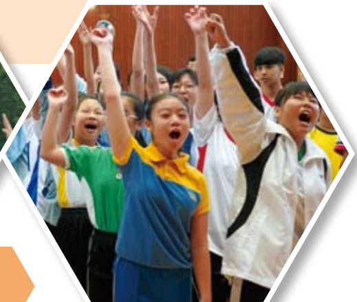
暑期舉辦的中一紀律訓練