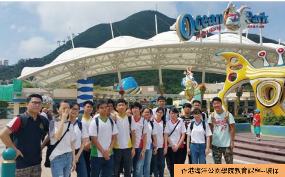
香港海洋公園學院教育課程--環保