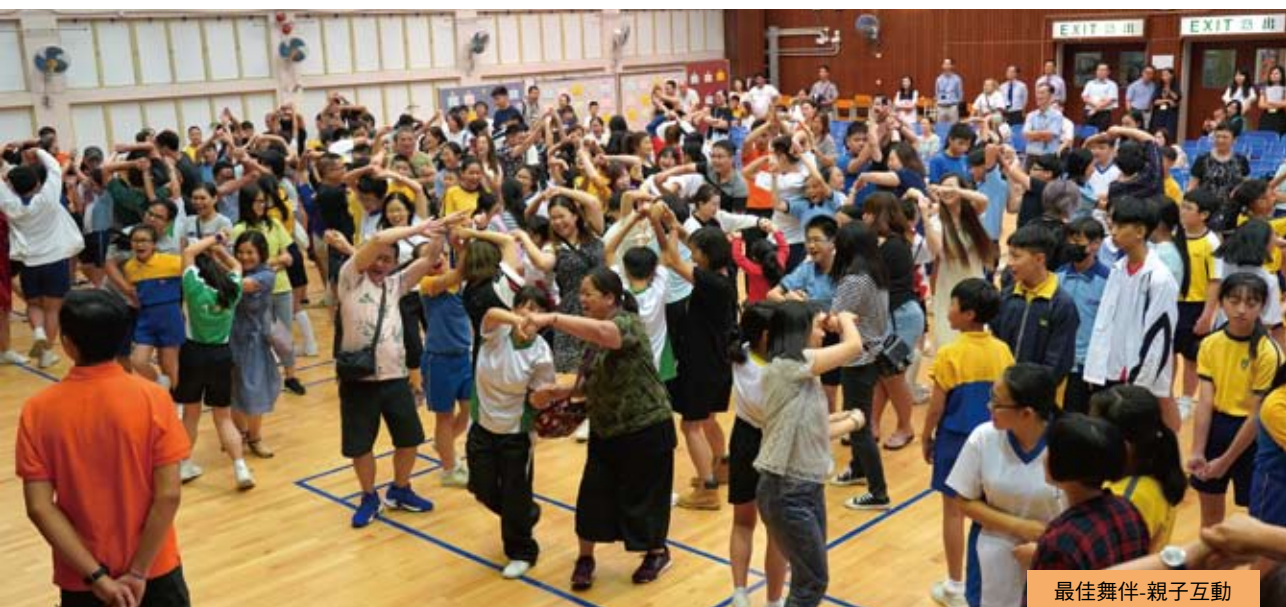
最佳舞伴-親子互動