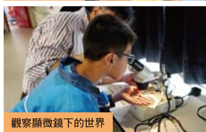
觀察顯微鏡下的世界

體育活動交流： 透過友校小學排球邀請賽、籃球邀請賽、接力邀請賽等活動，使各友校小學的同學互相切磋球技，鍛鍊體魄，同時亦在區際比賽前作熱身比賽，一舉兩得，因此深受各友校小學老師及同學歡迎。