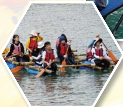
中二外展訓練-齊心事成