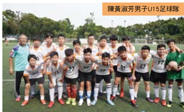
陳黃淑芳男子U15足球隊