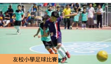
友校小學足球比賽