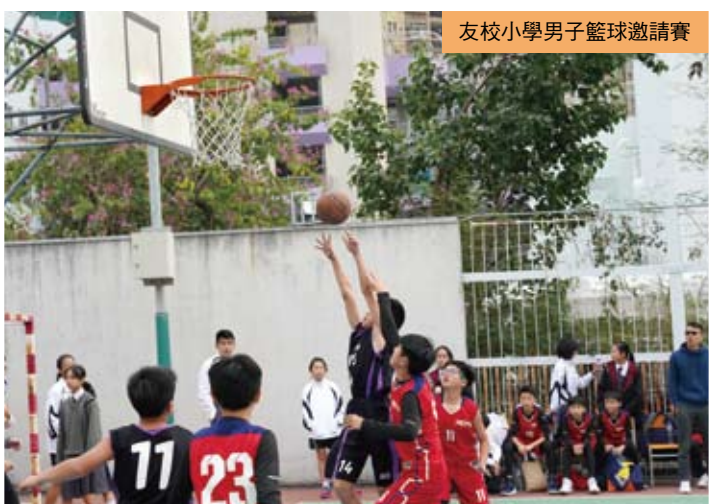
友校小學男子籃球邀請賽