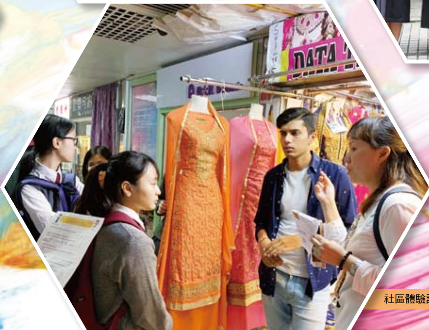
社區體驗計劃-了解少數族裔人士的生活