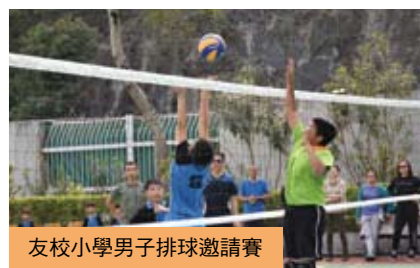
友校小學男子排球邀請賽