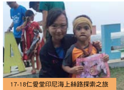
17-18仁愛堂印尼海上絲路探索之旅