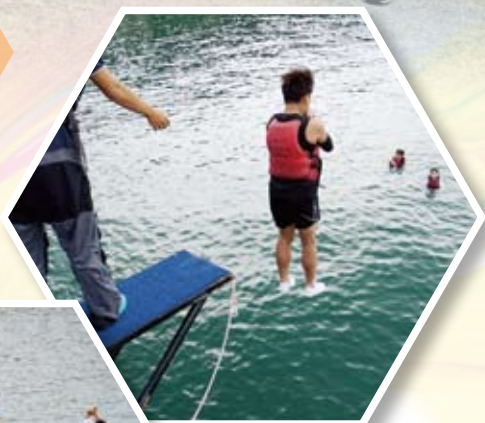
中二外展訓練-突破自我

2019-2020學年，學生發展委員會以「豐富學生多元學習經歷，讓他們發揮所長，提升自我價值」及「強化學生自律訓練，確立學生良好品格，從而建立良好的校風」為目標，運用以下策略，達致上述目標。