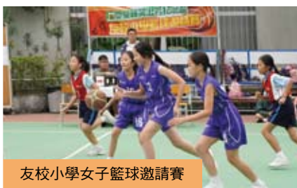
友校小學女子籃球邀請賽