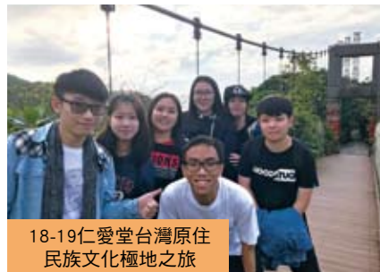
18-19仁愛堂台灣原住民族文化極地之旅