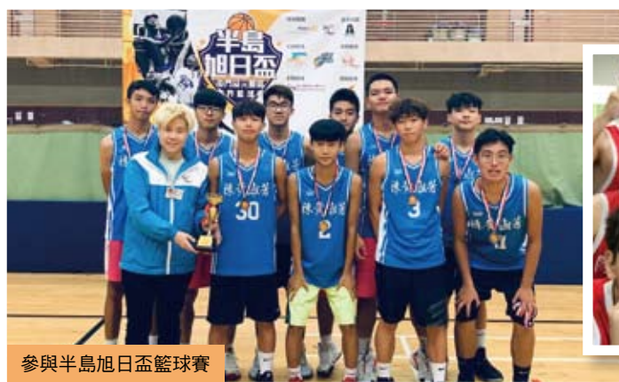
參與半島旭日盃籃球賽