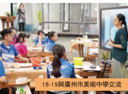
18-19與廣州市美術中學交流