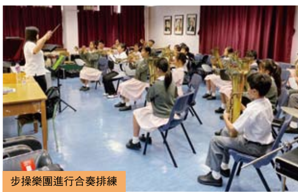
步操樂團進行合奏排練