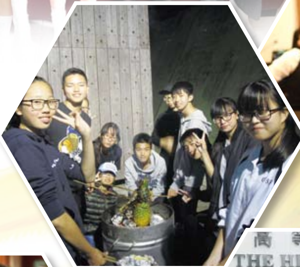
領袖訓練營-共晉晚餐