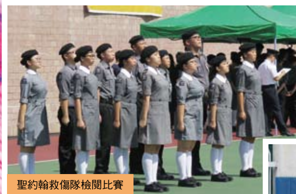
聖約翰救傷隊檢閱比賽

2019-2020學年，課外活動組開辦43個學會小組，以配合「豐富學生多元學習經歷，讓他們發揮所長，提升自我價值」的目標。本校推薦學生參加不同類型的比賽，培養他們精益求精的態度。計有運動、藝術、音樂、舞蹈、戲劇、STEM比賽等多元化的活動。