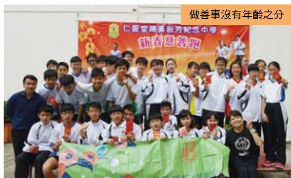
做善事沒有年齡之分