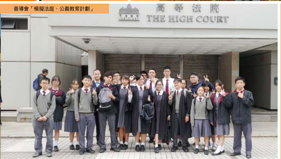
善導會「模擬法庭·公義教育計劃」