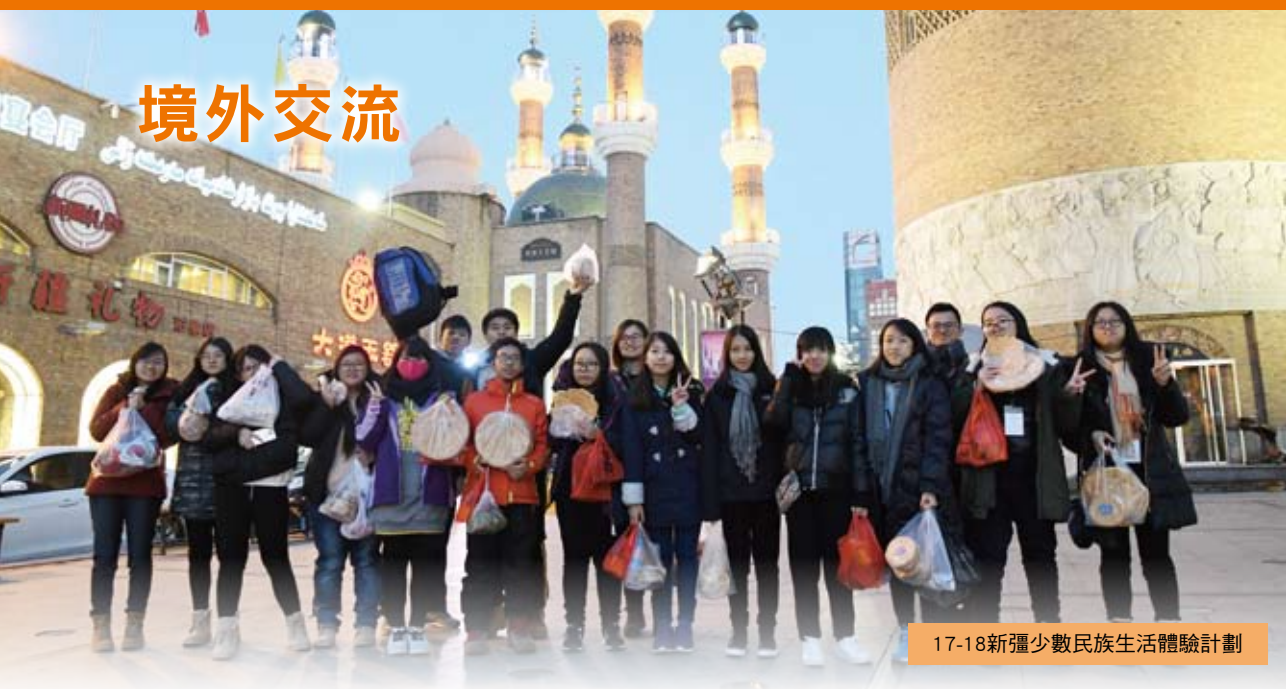
17-18新疆少數民族生活體驗計劃