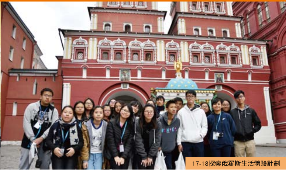
17-18探索俄羅斯生活體驗計劃