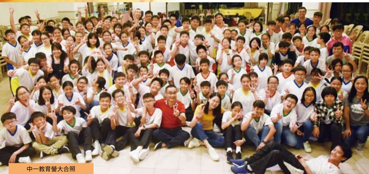
中一教育營大合照