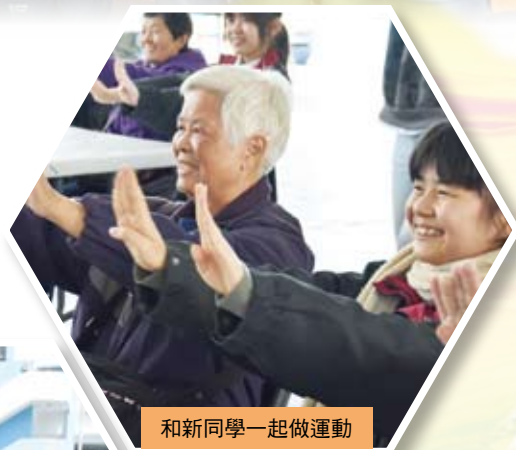
和新同學一起做運動