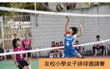
友校小學女子排球邀請賽

體育活動交流： 透過友校小學排球邀請賽、籃球邀請賽、接力邀請賽等活動，使各友校小學的同學互相切磋球技，鍛鍊體魄，同時亦在區際比賽前作熱身比賽，一舉兩得，因此深受各友校小學老師及同學歡迎。