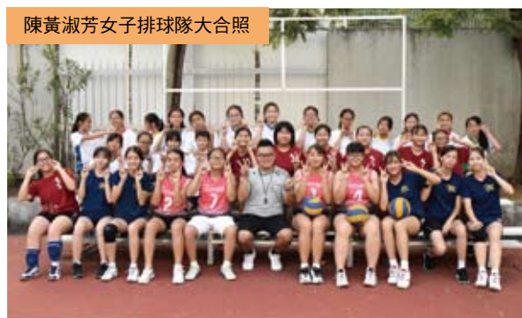
陳黃淑芳女子排球隊大合照