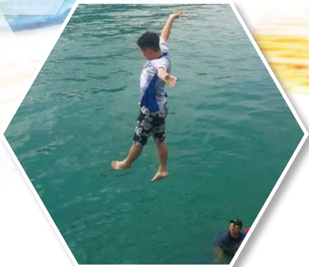
乘風航伙伴計劃-自我挑戰