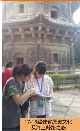
17-18福建省歷史文化及海上絲路之旅