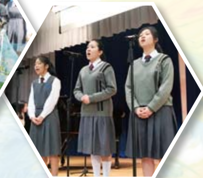
The Sound of Chan Wong