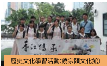
歷史文化學習活動(饒宗頤文化館)