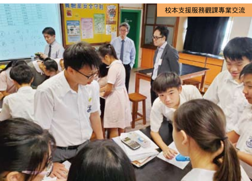
校本支援服務觀課專業交流

透過一連串的課堂和活動，除了讓學生學習不同學科的基礎知識和技能外，更希望培養他們成為具備資訊素養的人。