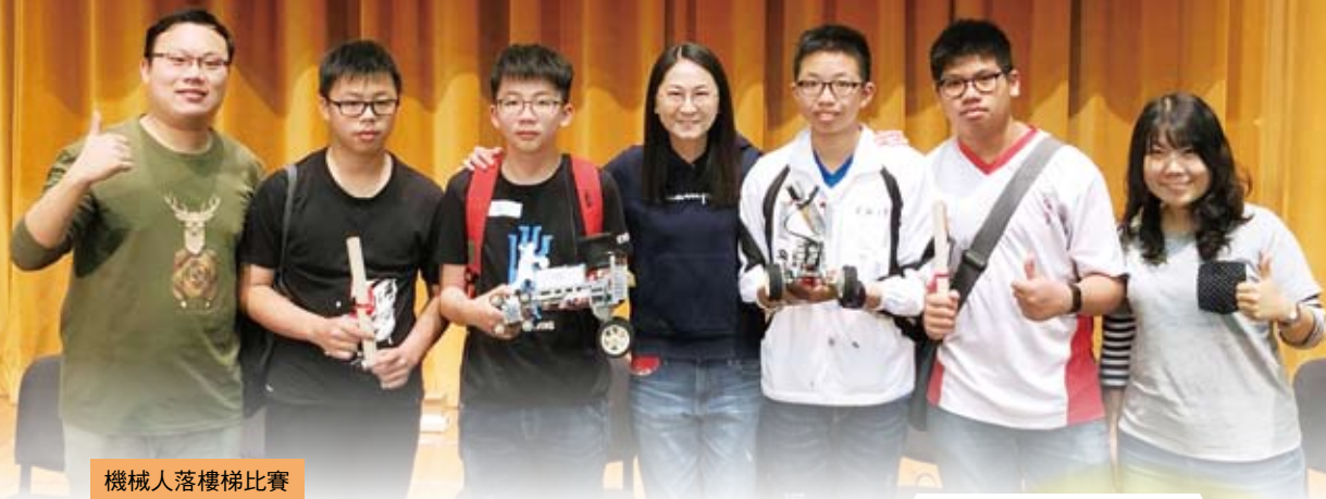
機械人落樓梯比賽