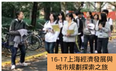
16-17上海經濟發展與城市規劃探索之旅