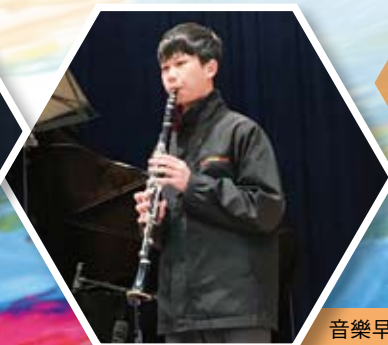
音樂早會-單簧管獨奏