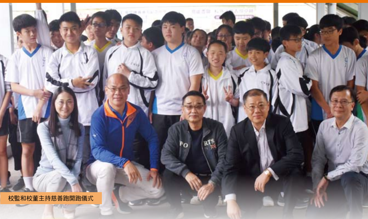
校監和校董主持慈善跑開跑儀式