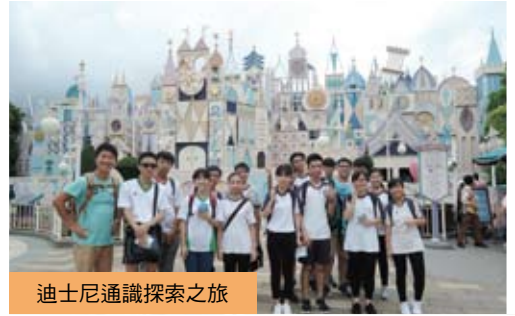
迪士尼通識探索之旅