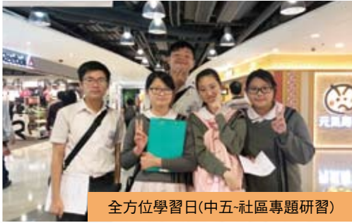
全方位學習日(中五-社區專題研習)