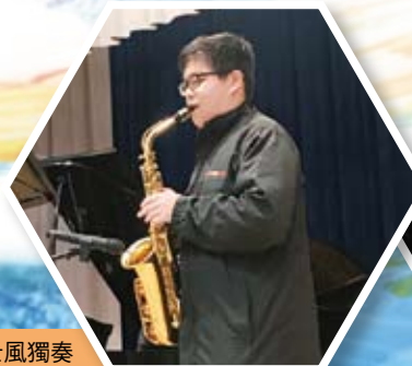
音樂早會-色士風獨奏