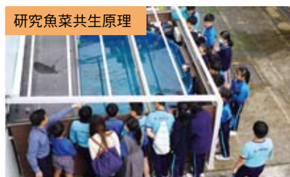
研究魚菜共生原理