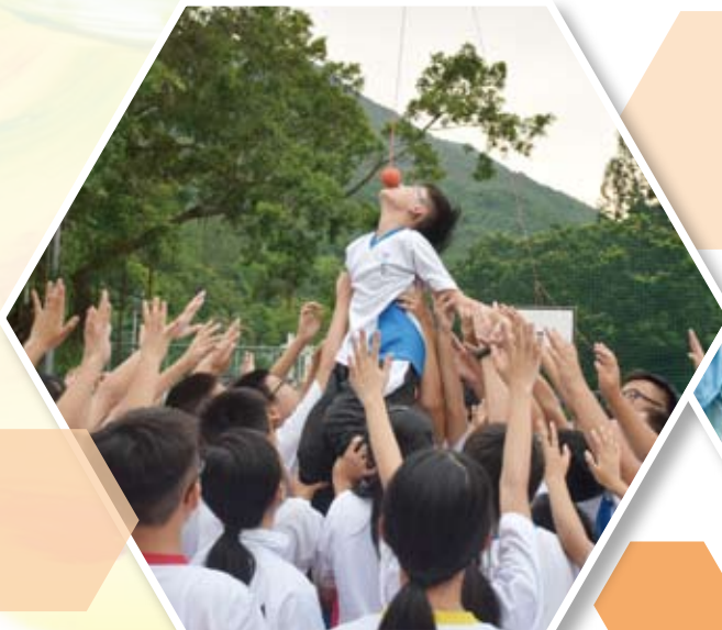
中一教育營-互相支持及鼓勵