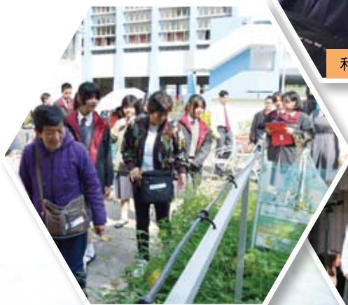
長者到校參觀農圃