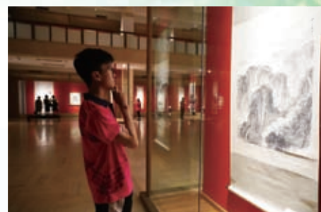
參觀廣東美術館，欣賞廣東名畫家的水墨作品