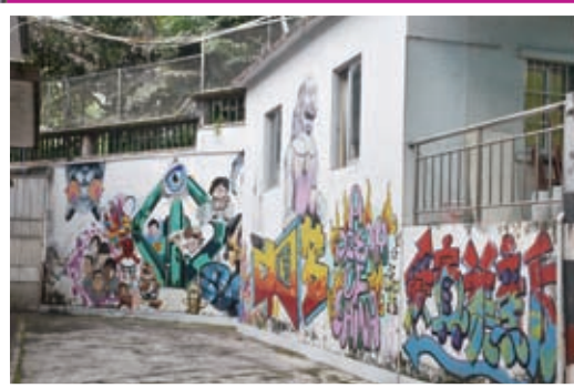
美中的壁畫角讓學生發揮創意