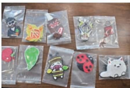
美中同學親自製作的3D打印筆匙扣