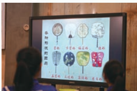
展示團扇千變萬化的形狀