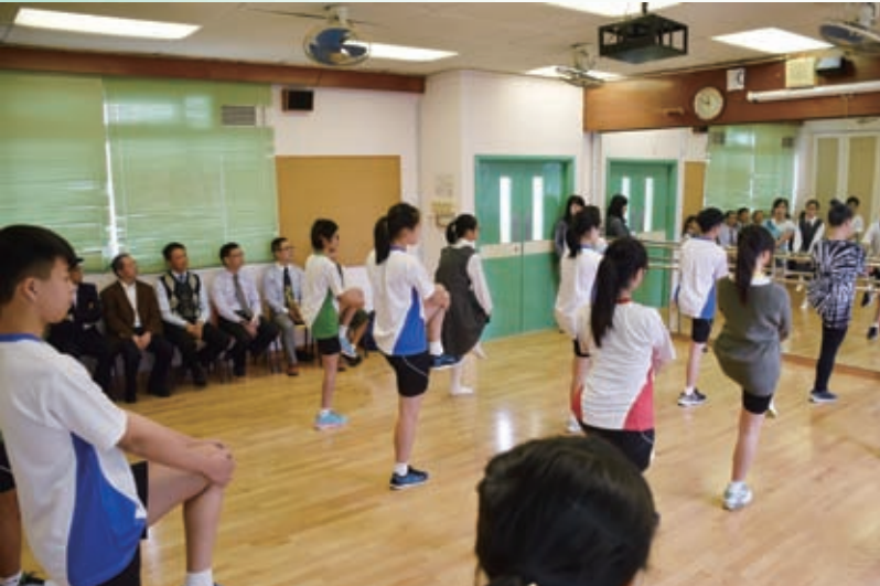
本校藝術文化課，學生充滿活力