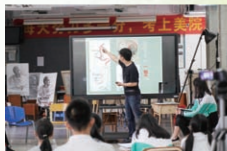
美中老師教授突出頭部立體感的方法