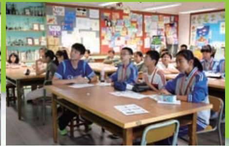
大家都展現出認真的學習態度