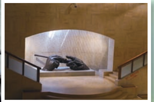
廣東美術館環境寬敞寧靜，展示不同種類的藝術品