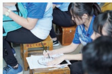
陳黃同學專注完成頭部陰影的練習