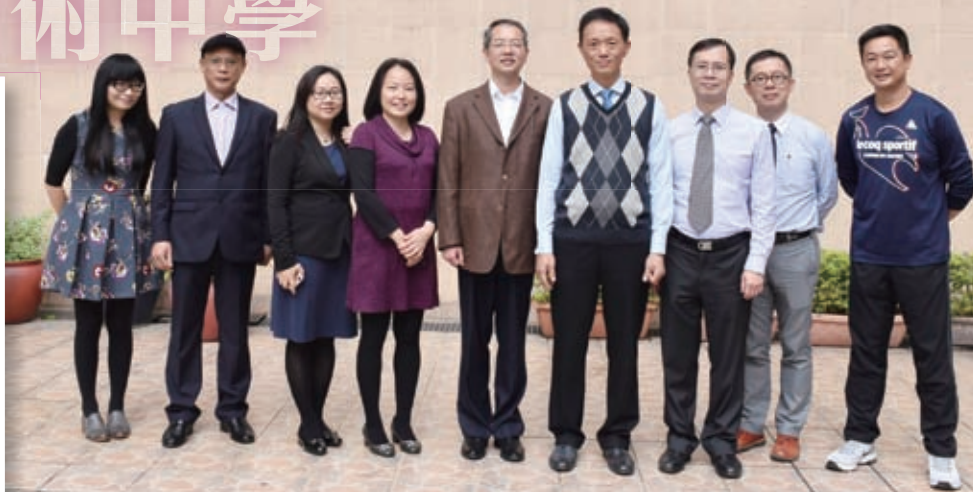
兩校互訪，建立友誼