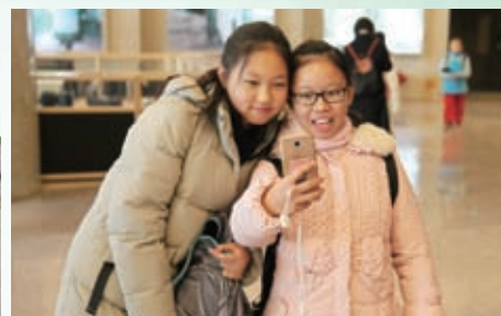
北京的同學，我們來個自拍吧！