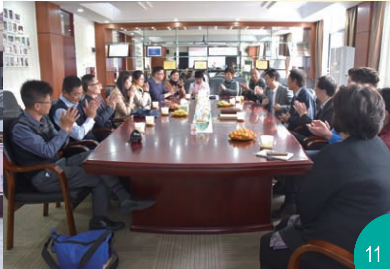
和南山實驗學校老師開會交流