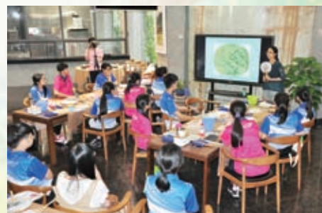
美中老師講解團扇的歷史