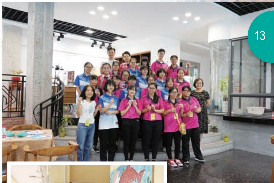
大家順利完成3D打印筆的作品