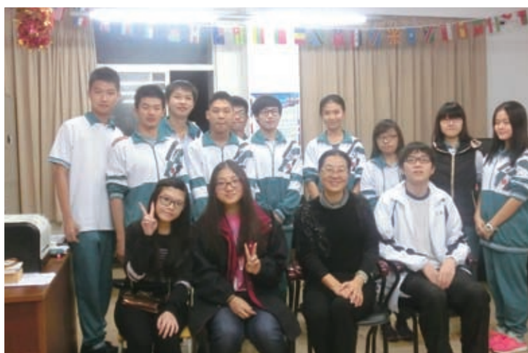
學生與廣州二中師生合照