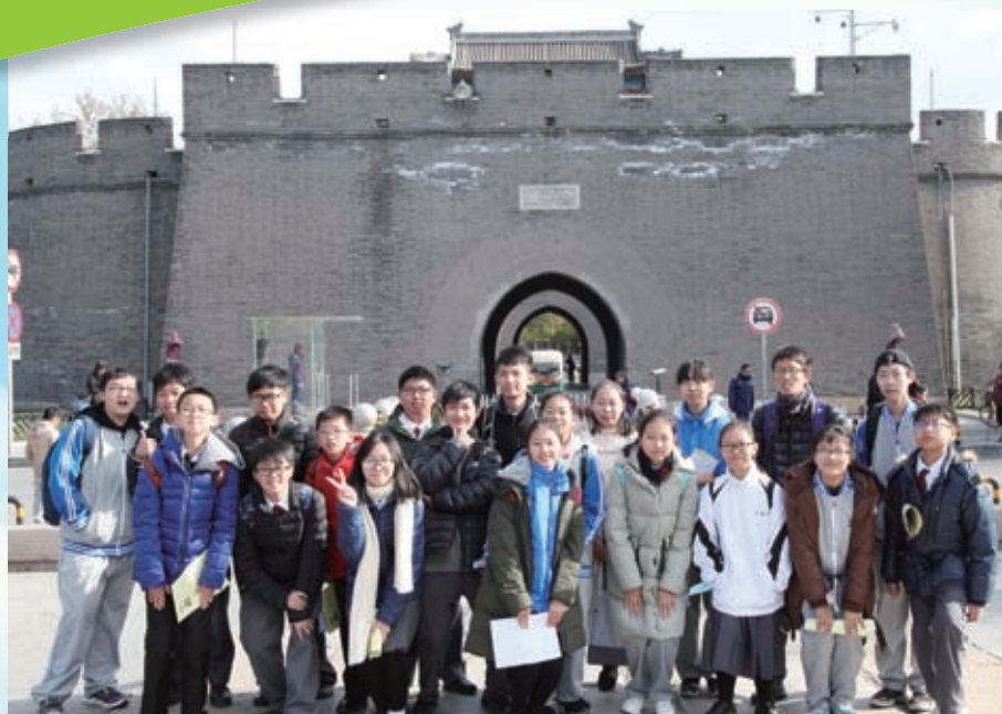
我們與北京同學在宛平城前留影