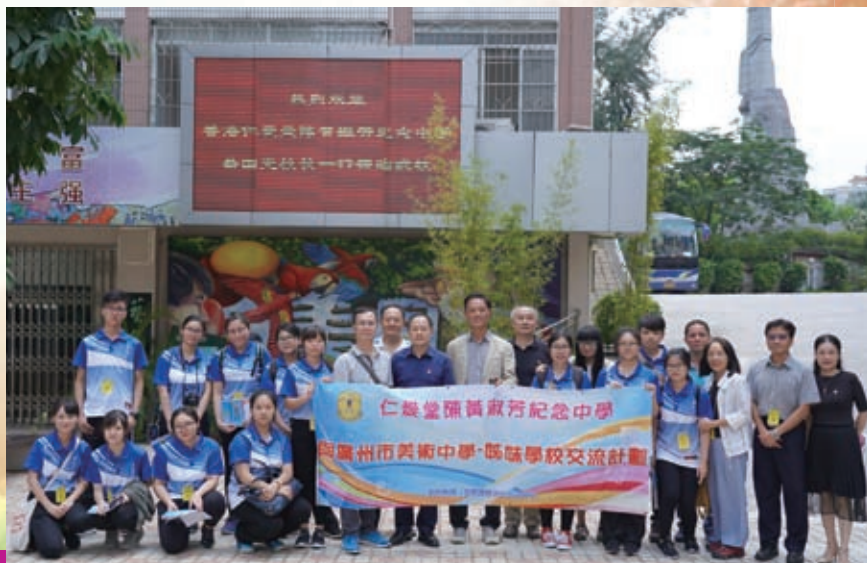
陳黃師生與美中黃校長、老師合影留念