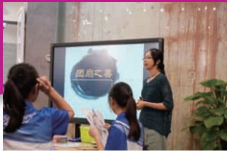
陳黃同學學習欣賞團扇的題材和構圖