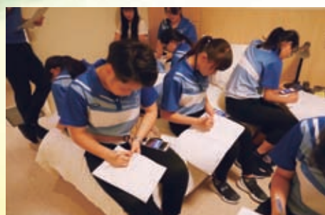
晚飯後，同學相約在酒店房內評賞美中同學的作品，並彼此交流旅程後的感想