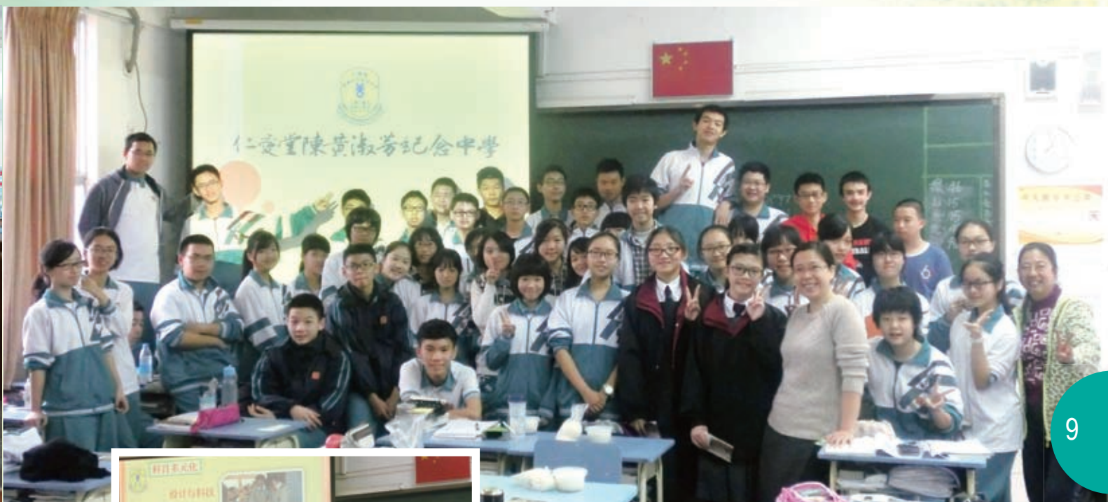
介紹本校特色後大合照