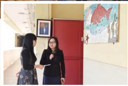
兩校老師分享教學心得