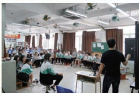
陳黃、美中同學都全神貫注地聽課