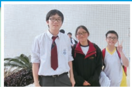
學生到訪廣州二中