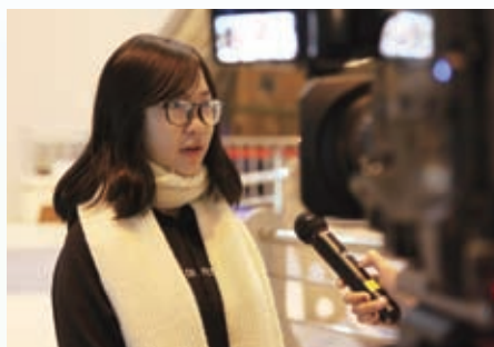
梅若蘭同學接受當地電視台訪問