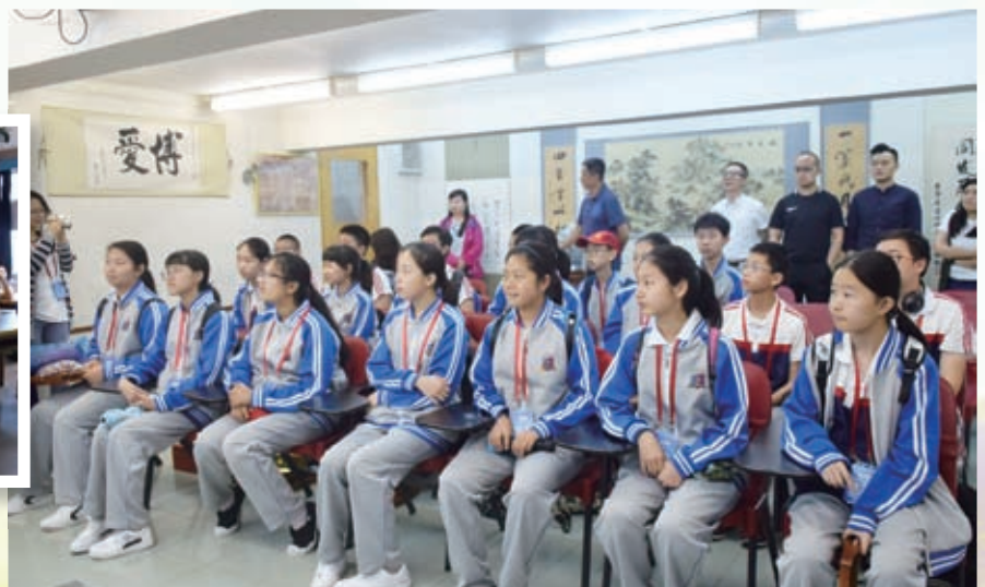
豐台八中的同學在文化室聚精會神地聽講