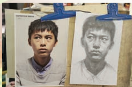
美中學生的出色的習作