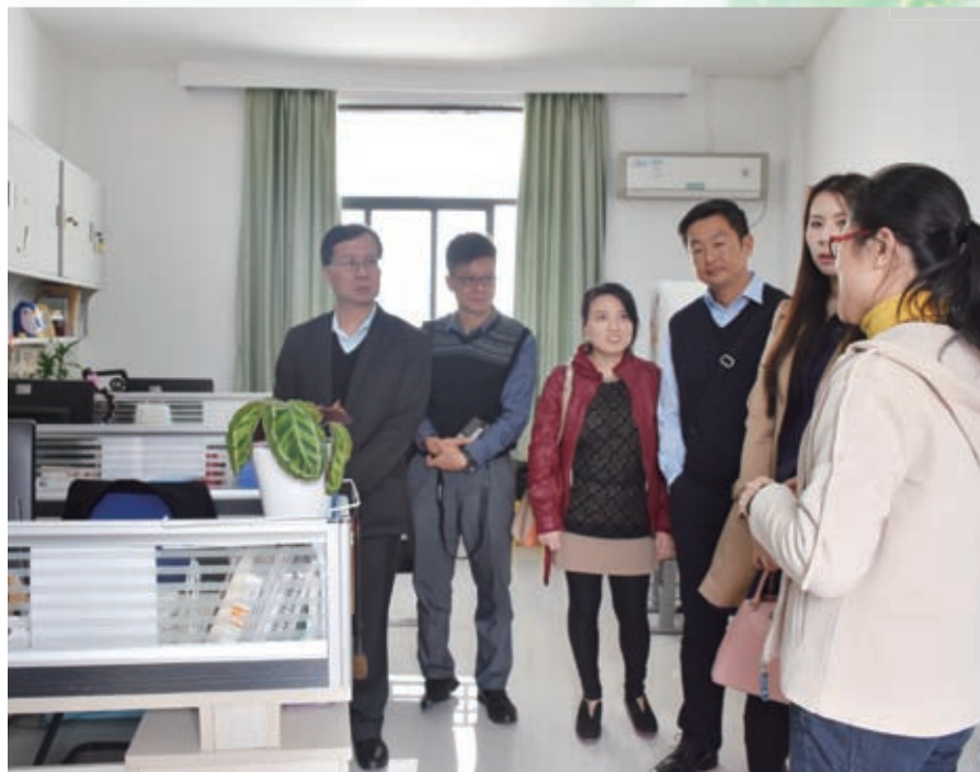
南山實驗學校的教員室