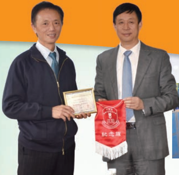
蔡校長致送紀念品