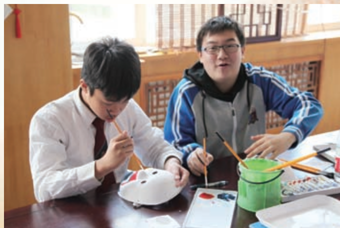
用心繪製獨特的臉譜