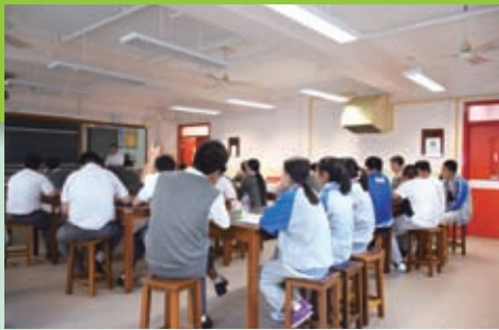
陳黃同學努力協助講解物理課的知識