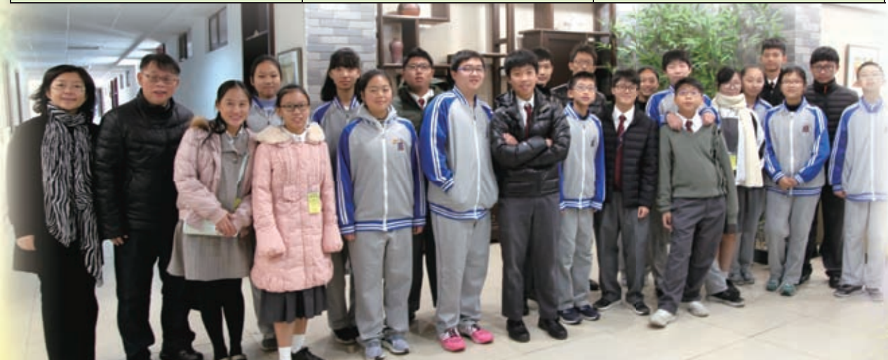
豐台八中校長、學生跟陳黃師生與教聯會代表大合照。