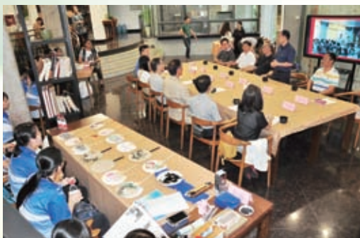
美中黃校長熱情招待陳黃師生到教工之家交流研討