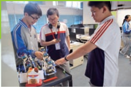
他們對我們STEM課程的作品也深感興趣