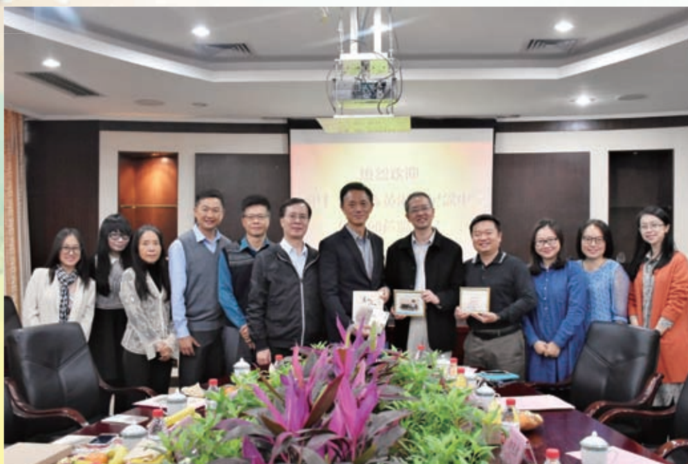
兩校互訪，建立友誼