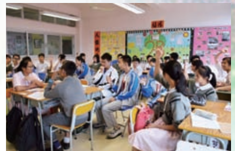
齊參與初中通識的討論