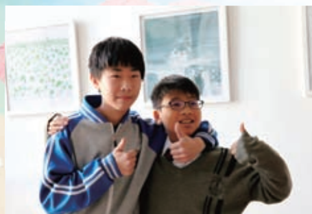
看我們跟北京的同學相處得多好！