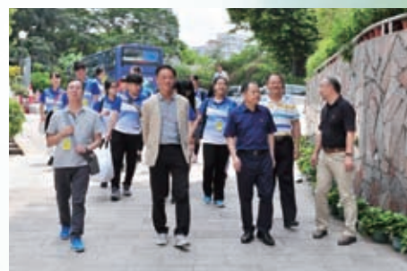
到達美中，美中黃隆基校長親自迎接