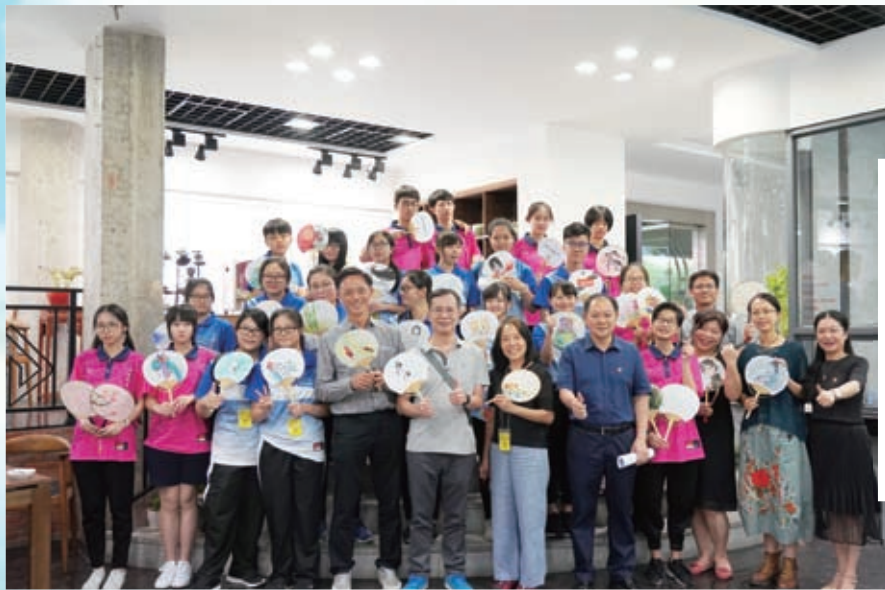
陳黃、美中師生的大作