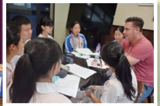
京港兩地同學與外籍老師交流