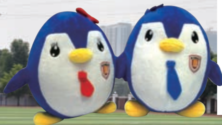
南山實驗學校致送本校的紀念品