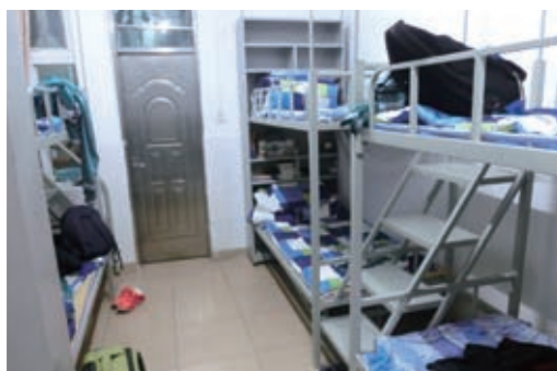
入住學生宿舍，體驗廣州二中學生生活