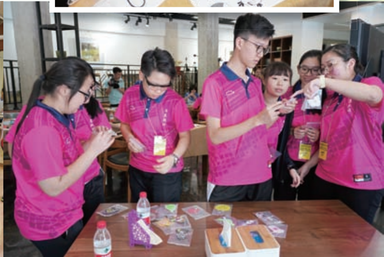
同學紛紛揀選喜歡的匙扣