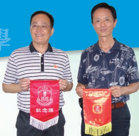
兩校校長交換紀念旗