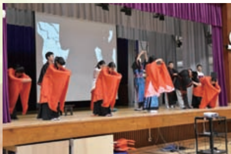
豐八同學更為我們表演了精彩的拜師禮