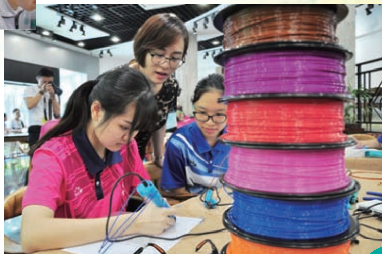
美中師生指導同學使用3D打印筆和膠條的技巧