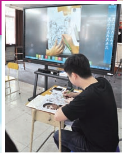
美中老師示範加強肖像立體感的技巧