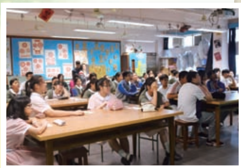
豐八師生參與陳黃美術課