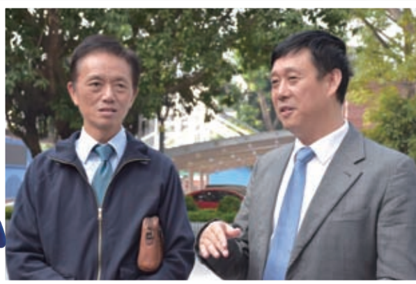
南山實驗學校校長向蔡校長介紹學校設施