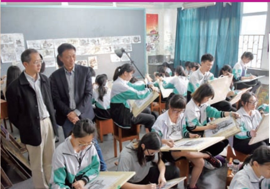
美中的素描課，學生投入專注