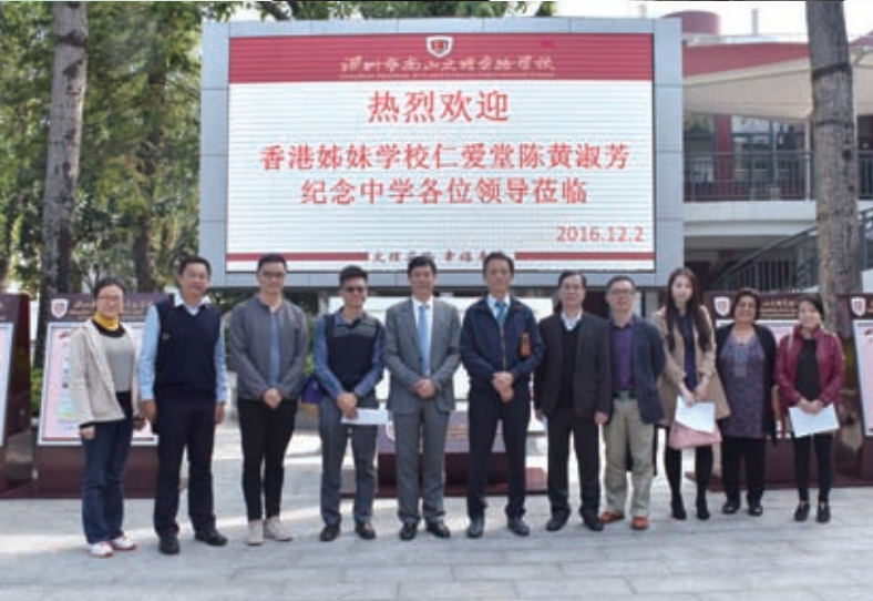
本校教師和南山實驗學校教師合照