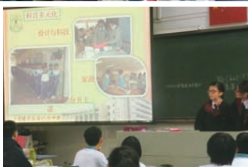
向廣州二中同學介紹本校特色