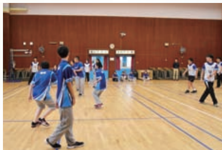
來比拼一下躲避盤