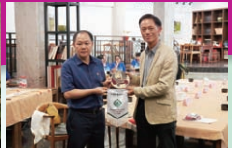
黃校長贈紀念品予蔡校長