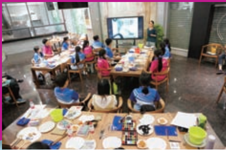
陳黃同學都留心聽課，了解團扇的來由